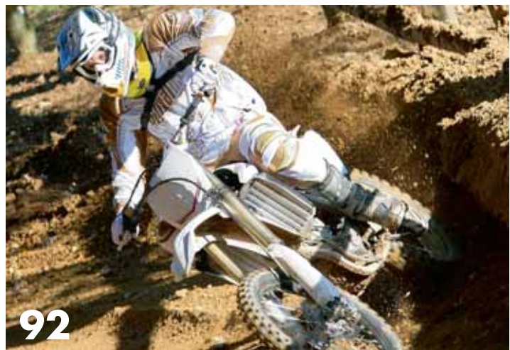
Technik: Yamahas Crosser YZ 450 F ist ein technisches Schmankerl.