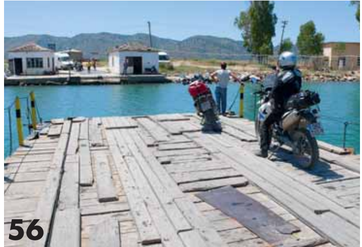
Die Wege durch Albanien sind manchmal etwas sonderbar.