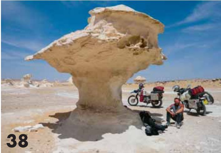
Immer am Nil entlang... eine ganz persönliche Quellensuche.