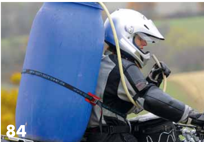
Trinkrucksäcke: Unterwegs trinken – es geht auch einfacher.